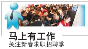
马上有工作 关注新春求职招聘季

本报2月18日讯(记者 林宏岩) 冬去春来,新的求职季又开始了,用人单位急着要招人,求职者也求职心切,亟需一个交流的平台。为此,本报“招聘求职公益平台”再次启动,发布“用工榜”和“求职栏”,免费选登求职和招聘信息。