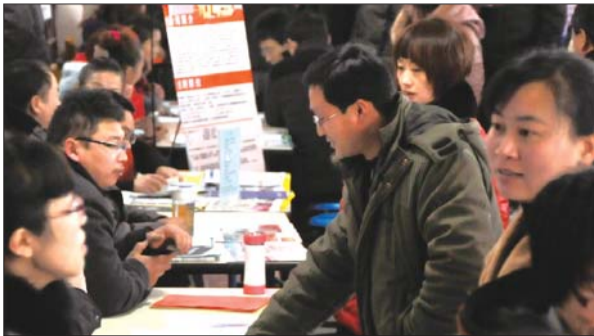
本次招聘会吸引了大量单位与求职者参加。

莱州市就业办负责人说,两家合办招聘会后,宣传范围将更加广泛,为企业提供了更方便的人门平台,也为用工企业和求职者提供了更便捷的交流平台。一家企业招聘人员说:“这场招聘会不光免费提供摊位,还免费提供其他就业服务,