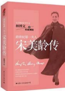
《跨世纪第一夫人宋美龄传》 作者:林博文 出版社:国际文化出版公司

这是一本逻辑学的趣味科普书。作者用逻辑学这个小工具,为我们一层层揭开了语言、人际关系、金钱游戏和数字迷宫背后隐藏的规则。让你在轻松的阅读中,学到逻辑学这门很有用的知识。院士刘炯朗用最深入浅出的文字,教你一次搞懂这些藏在事物背后的定理!