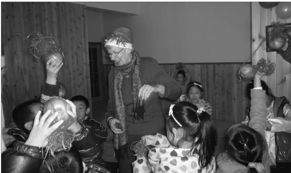
张店某幼儿英语培训机构里的外教在与孩子们做游戏。

将于4月1日起实施的《山东省学前教育规定》中明确提出了严禁幼儿园组织外语、珠脑心算、拼音等活动。学前教育的英语市场便闻风而动,不少幼儿园在新学期取消了英语培训,而这并没有阻挡家长给孩子报英语培训班的热情。