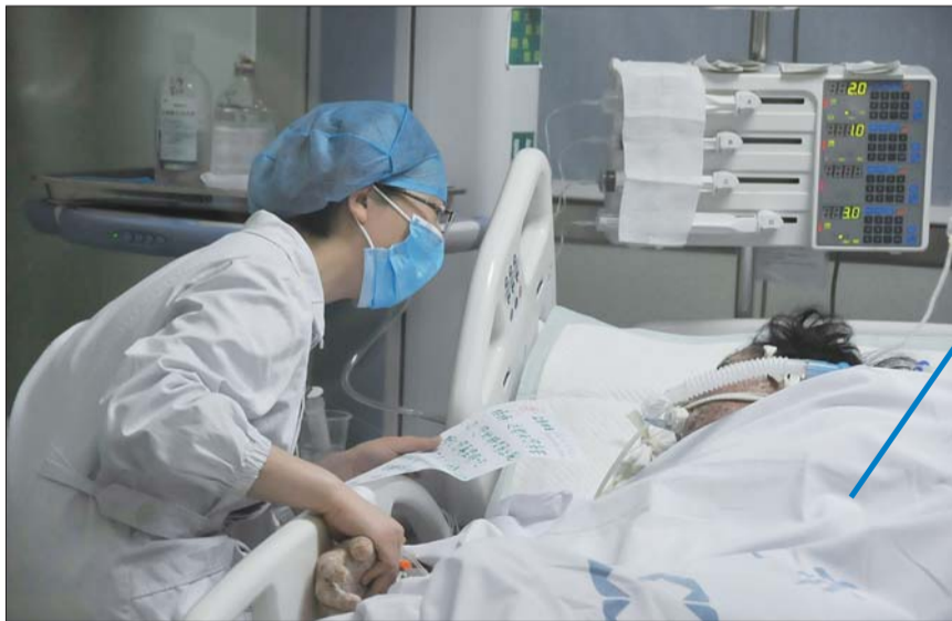
护士们每天都会把“病房家书”读给韩女士听。

“我们想让老人感受到子女对她的牵挂和孝心,以及我们医护人员的支持。”重症医学科的护士长吕春玲说,现在轮流照顾老人的护士已经把为老人读信当成了每天必做的功课,大家都衷心希望老人会在孩子这种孝心和爱的感染下早日战胜病魔。