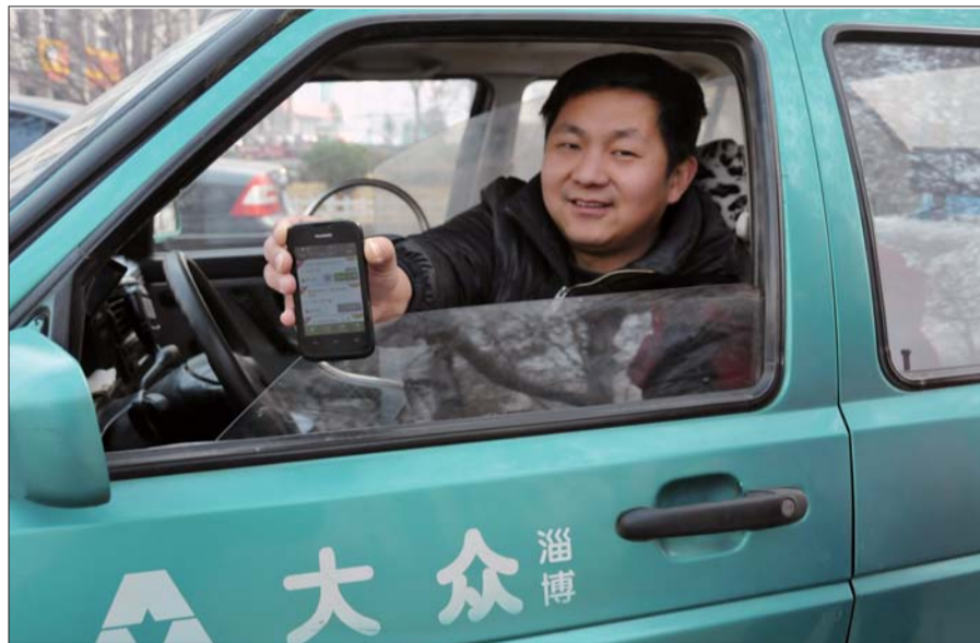
一出租车司机向记者展示他使用打车软件的接单。

没听说过打车软件,那你就out了。近日,两大打车软件——“快的”和“嘀嘀”竞争异常火爆。嘀嘀打车表示,从2月18日起,乘客使用嘀嘀打车并且微信支付,每次能随机获得12元至20元不等的补贴,每天3次。快的打车则遵守“永远多1元”的承诺,宣布从2月18日15点开始,用快的打车并用支付宝付款每单最少给乘客减免13元,每天2次。在两家电商烧钱大战时,出租车司机和乘客成了最大获利者。