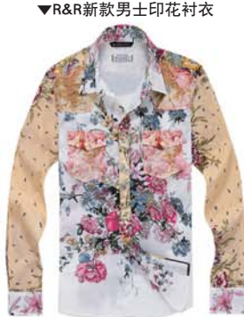
▼R&R新款男士印花衬衣