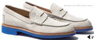
◀in Tod's 2014春夏男鞋