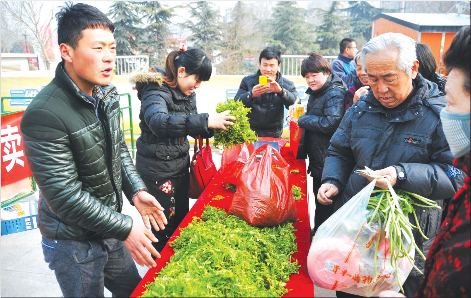
助卖活动吸引了很多市民。