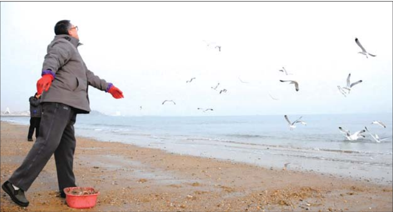
第一海水浴场的工作人员每天都会给海鸥喂食。

场管理所所长张海峰告诉记者,此前也断断续续进行过海鸥喂食,当年因为非典就停了下来,直到2011年冬天,才重新开始,已经坚持了3个