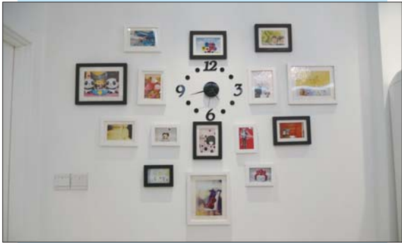
城市人家装修实景图-装饰墙