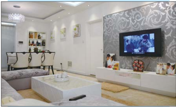
城市人家装修实景图-客厅