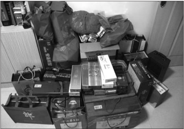
一市民储藏室门口堆满了收到的年货。

“商家私自以低价收购再进行销售，不仅偷逃了国家税款，还干扰了市场正常秩序，没有正规的进货发票，是不符合规定的。”工商局工作人员提醒市民，购买烟酒时一定要谨慎对待。