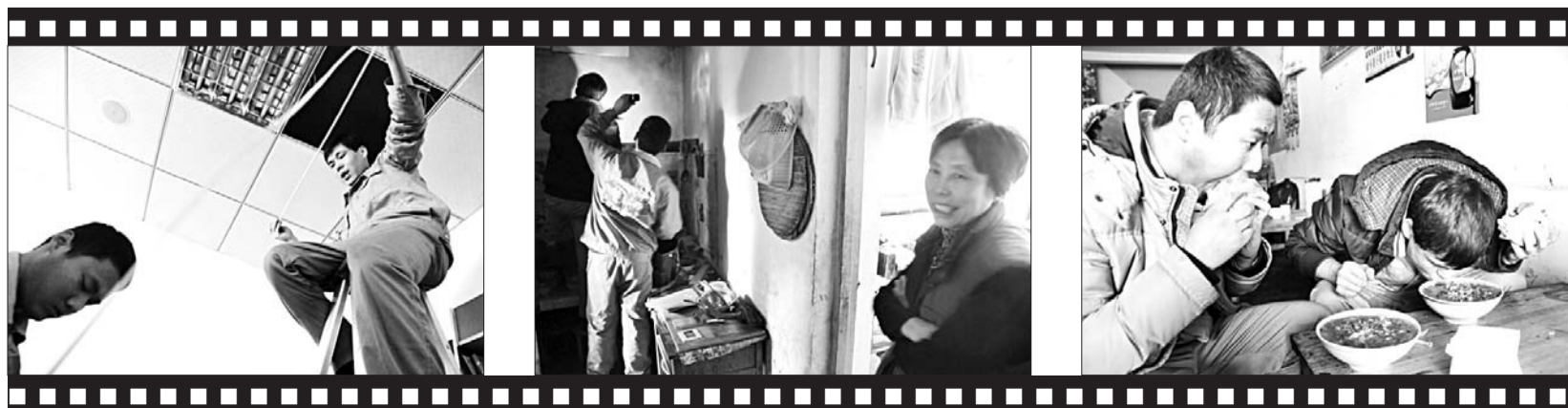
师傅们正在维修电路。