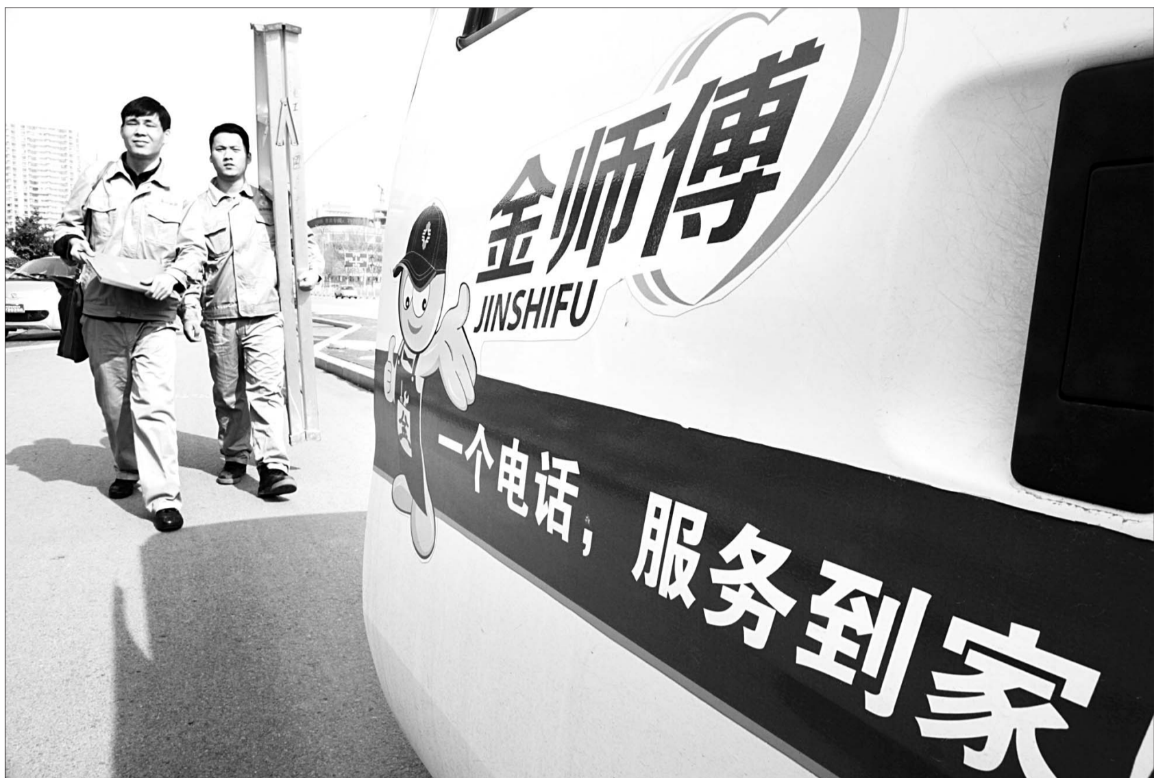
师傅们认真负责,一个电话,服务到家。