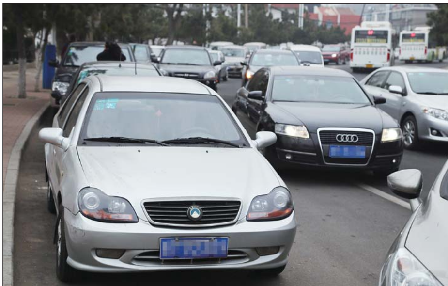
24日,环山路因为葡萄山小学开学堵得一塌糊涂。

交警一大队副大队长刘建介绍说,从今年的开学首日交通情况来看,凡是临近学校的路段均出现了较大的交通压力,与以往不同的是,一些远离干路但临近支路的中小学校周边道路,如