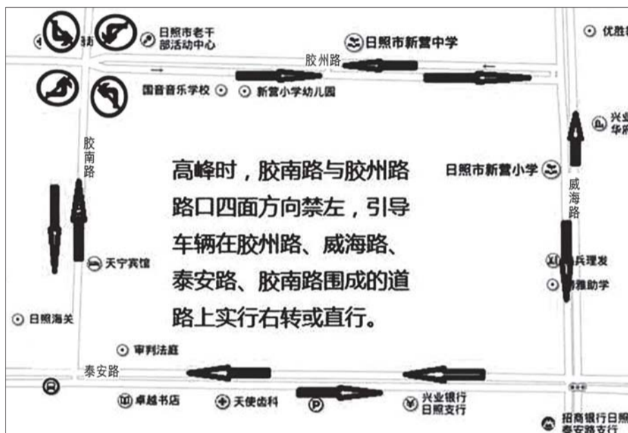
新营小学周边道路交通组织示意图