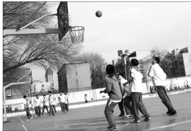
27日,山师附中的学生在体育课上打篮球。

2010年全省学生体质与健康调研显示,与2005年相比,7-12岁斜身引体城市男生平均下降11次;13-18岁中学生耐力跑素质出现一定程度的下降,城乡男生1000米跑成绩分别平均下降6.4秒、7.6秒,城乡女生800米跑成绩分别平均下降6.6秒、6.9秒。