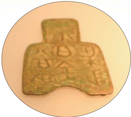
此枚“梁正尚百当”很受泉友欢迎。