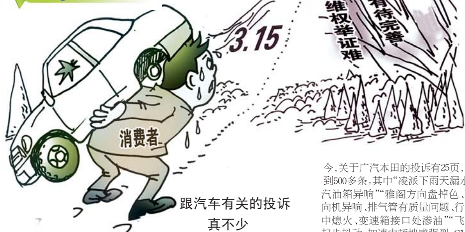
跟汽车有关的投诉真不少