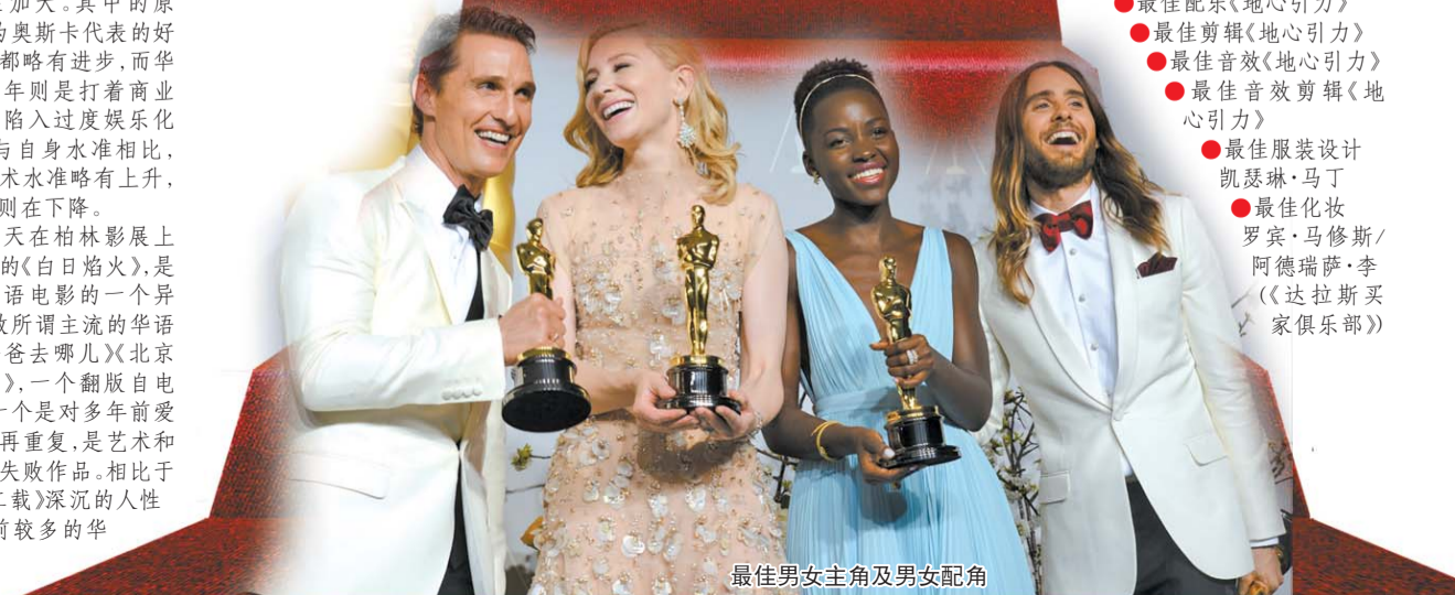
最佳男主角及男女配角