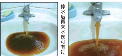
停水后自来水滤芯可有可无

据了解,该款水质处理器可自动检测家中自来水水质的好坏和是否达到安全健康饮用水标准:1、判断污染程度;2、含泥沙铁锈程度;3、是否影响健康。特殊材质的滤芯还能过滤改善自来水水质,确保全家人都能喝到健康、卫生、安全的好水。