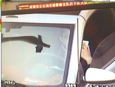
▶从交警指挥中心监控中，能清楚地看到有司机在用手机。