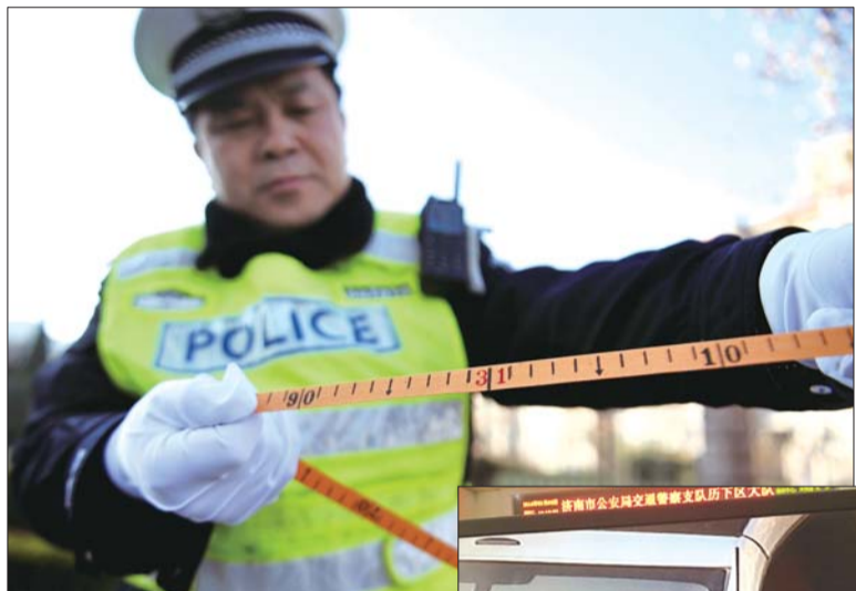
▲交警测验后现场量出盲驶距离。