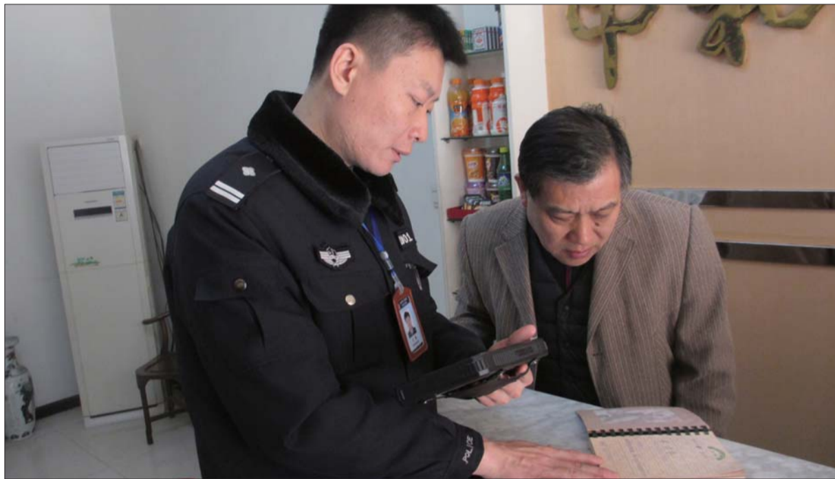
本报记者 张汝树 通讯员 李琳

“不用再翻看笔记，不用再翻找档案，不用再开会才能布置任务，只要打开民警随身携带的“云鉴”，就可以查询所需的基本信息、查看社区治安状况、接收上级的指示，这或许能简单概括“社区云警务”。5日，记者从周村公安分局了解到，现在他们使用的社区云警务在全国来说也是首创。