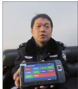
民警展示“云鉴”设备。