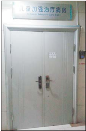
弃婴正在病房内观察。

本报3月6日讯(记者 王兴飞 实习生 樊鹏莉) 医院昏暗的地下停车场一角,一辆存放废品的三轮车上放置的纸箱无风自动。当保洁员打开纸箱的那一刻,尖叫声随即响起,接着便是响彻停车场的婴儿啼哭声。6日上午,一名约3个月大的女婴被丢弃在齐鲁儿童医院地下停车场里,除了包裹和纸箱外,陪同女婴的还有1000元钱。