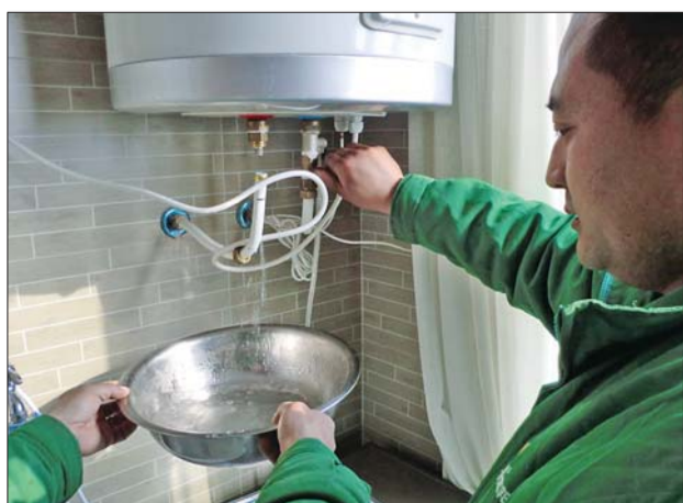
检测员对接太阳能的水进行检查未发现问题。