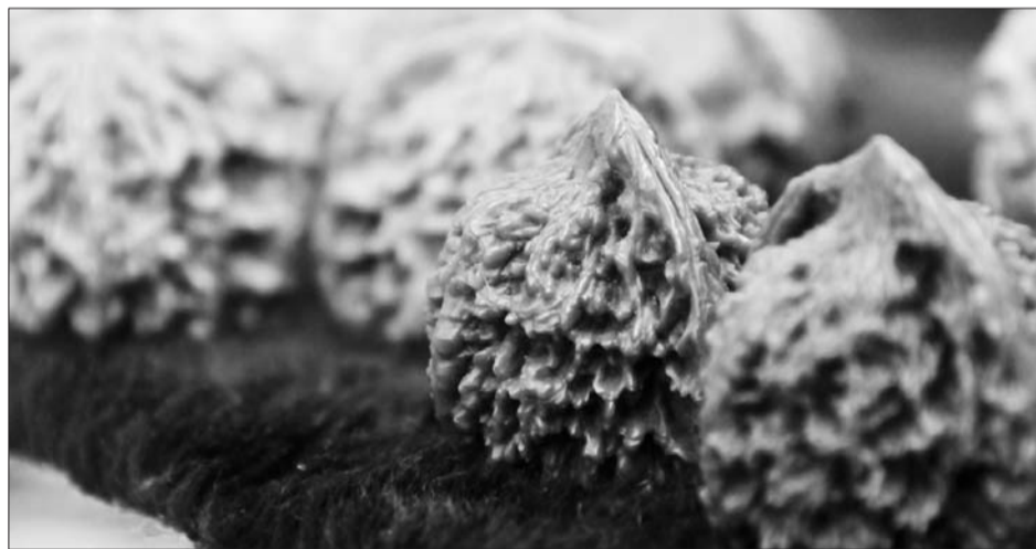
核桃盘得越久，颜色越光亮。