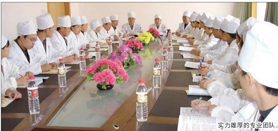
实力雄厚的专业团队。

民政部、中华医学会等部门授予“全国优秀中医医疗机构”、“全国先进民间组织”、“全国‘三好一满意’示范医院”、“全国医院医疗科技创新奖”等荣誉,并于2011年11月,被联合国世界和平基金会确立为白癜风科研与诊疗示范基地。当前,医院在山东各地市、北京、上海等地已设立技术推广中心近20个,举