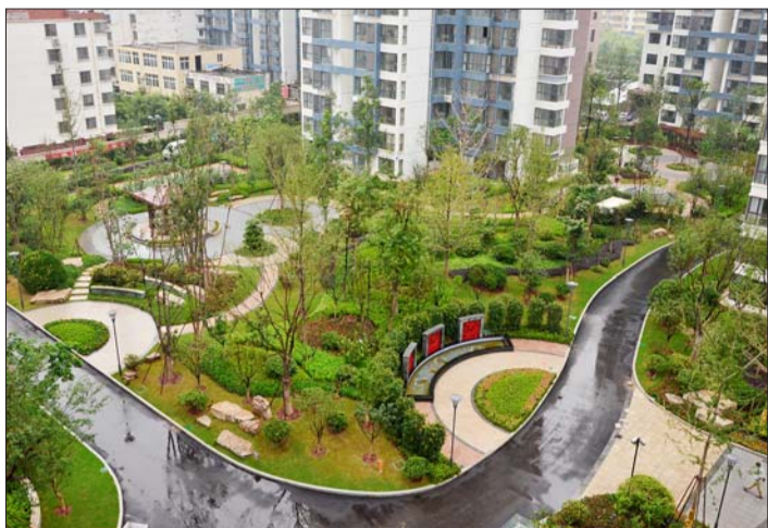
▲中央城园林景观 ▶清晨的一缕阳光