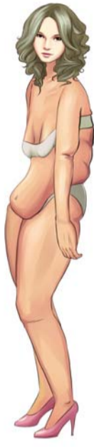
身材不做专业管理,变形老化影响整体形象和气质。

以往美体行业针对女性身材问题,基本以减肥卖产品为主,以控制饮食为主配合其它方式减少体重。反弹,再减,再反弹,促使客人重复消费,停止服务,体重马上增加。有的体重降下来了,结果导致身材局部变形,反而使身材更难看,不能从根本上解决问题,想让身材真正变漂亮很难。现在,这个问题终于可以得到解决,著名身材专家——罗丹女士(罗丹形体管理机构创始人,多年从事营养学、人体功能学、人体美学及延缓女性身材老化研究,首创全新美体新模式改变中国美体行业)在烟台建立罗丹形体管理工作室。罗丹认为,从专业的角度讲,针对不同年龄、不同体质,根据不同的变形原因,制定不同的改变方案,只有专业,才能让客人真正有一个好结果。绝对不能不分析变形原因,所有人千篇一律减体重,甚至采取