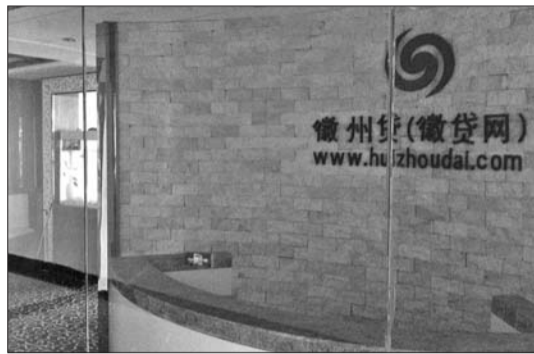
原本人来人往的徽州贷公司已经人去楼空。