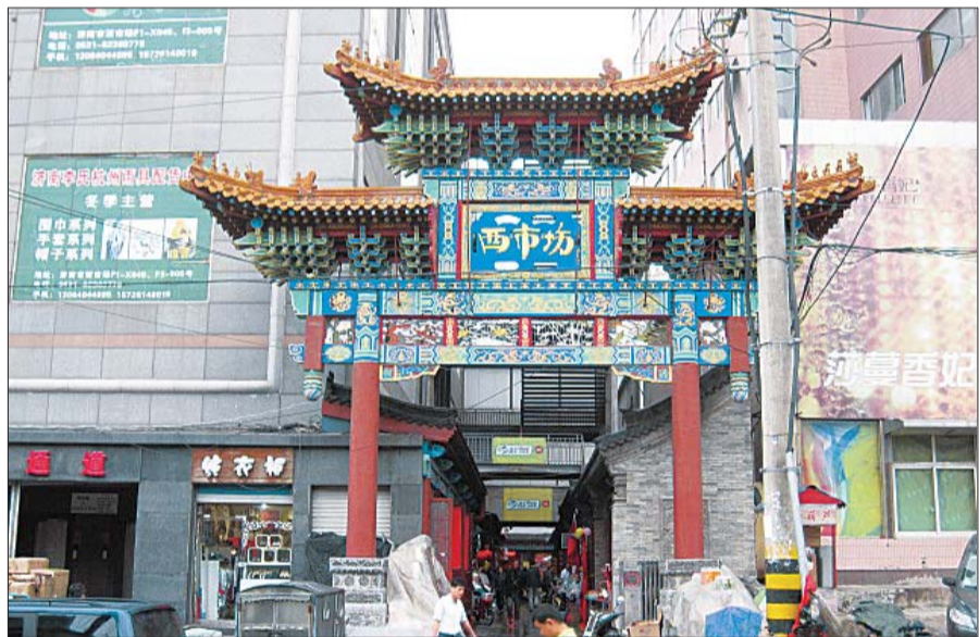
▲西市场西门(2013年5月拍摄)

据《槐荫区志》记载,“明代前,自南大槐树东首向北穿中大槐树东街、经二路,至北大槐树西首,有一土石岗,南高北低,蜿蜒起伏,貌似长龙,故名盘龙庄。1573年(明万历年)前,因庄内多古槐改称大槐树庄。”传说由于西市场恰好建在龙头处,而西市场地下又埋有龙珠宝藏,盘龙吐珠化为福瑞的地气滋养这片土地,所以此处成为古槐并茂、商气繁荣、人流旺盛的风水宝地。究其商业传统和经营商脉,我个人认为,大凡经商者都笃信诚信经商和风水宝地能招来财富的信条,在某种意义上说,这三个正门的设置和保留,可能与早年的传说和传统商业习俗有关,也可能与招贤纳士、方便出入、财源广进有着直接的关系。