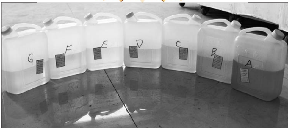
7家加油站汽油的含硫量不同。

本报3月11日讯(记者 杨青) 车用汽油硫含量是否达标,一直是市民广泛关注的问题。今年1月1日起国内汽油全面升级执行国IV标准,新标准对硫含量的要求更为严格。近日,本报对滨州7家石化企业93#汽油硫含量进行了暗访检测,结果虽均达国IV标准,但不同品牌硫含量差距明显。