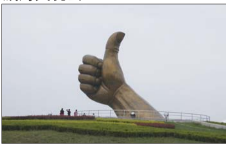
福如东海,大爱无疆

大乳山是集观光、旅游、休闲度假、康体养生、文化娱乐为一体的综合性旅游胜地。景区以景观独特的“大乳山”为中心,外有“小青岛”、“琵琶岛”、“竹岛”、“浦岛”等作屏障。山环水绕,相依相拥,祥和优雅,堪称海山泽国,世外桃源。