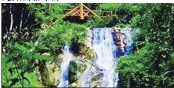
天然空调,消暑圣地

九如山瀑布群风景区是国家4A级景区、国家森林公园。以“八潭、九瀑、二十四泉、三十六峰”为核心景观,形成了山、瀑、栈、溪、泉为特色的景致。群山连绵,峰峦叠嶂,峡谷纵横,森林茂密,瀑布成群,栈道连缀。以自然山水景观为特色,集生态观光、休闲娱乐、养生度假为一体,是人与自然和谐相处的典范之作。