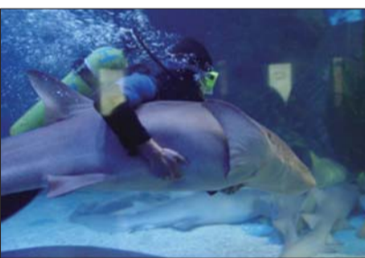
泉城海洋极地世界