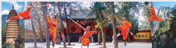
郑州·登封“天地之中”历史建筑群·嵩山

豫驾中原,优哉游哉。沿河南境内的太行、伏牛山系一路畅行,无边风光入画图。为了支持、鼓励各省(市)自驾游团队畅游河南,河南省旅游局推出一系列优惠措施,为自驾游团队送上优惠大礼包!