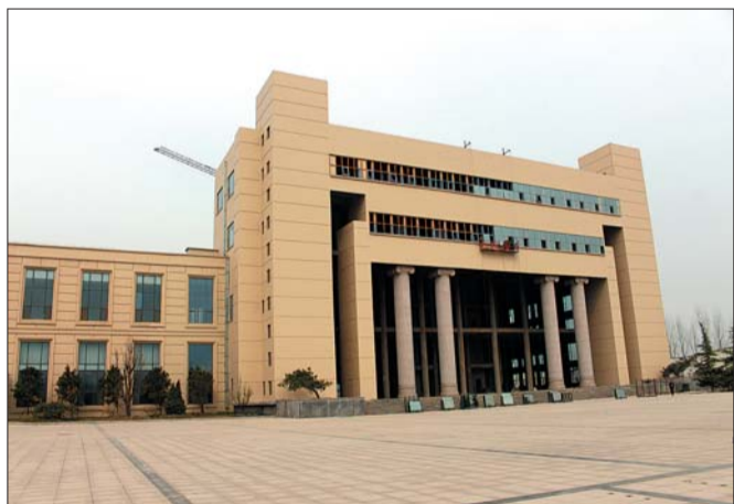
章丘双语国际学校将于今年9月份招生。