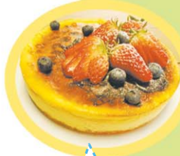
Home家庭烘焙坊的榴莲芝士和巧克力蛋糕。