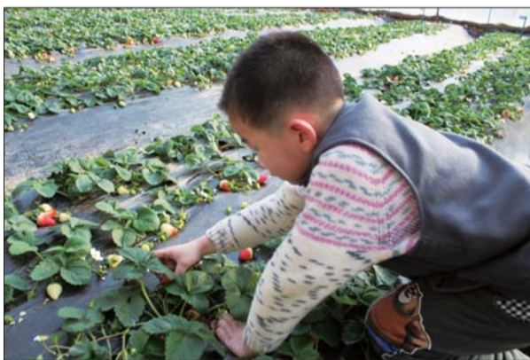
小朋友正在草莓采摘园内采摘草莓(资料片)。

施生态观光路网建设工程,计划投资900万元,再增生态路网30公里,并开工实施上庄