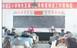
峰城区小学特色发展优秀教案推进工作现场会

强身健体,让学生在灿烂阳光下茁壮成长。该校本着一把手亲自抓,分管领导具体抓,确保活动有序、安全地开展。组织学生进行板报和广播宣传,使同学们的运动兴趣和广播宣传,使同学们的运动兴趣,集体感等充分被激发,也激活了学生健康第一的理念。学校坚持以活动为载体,激发师生练习书法的热情;每学期开展“全校硬笔书法比赛”和“校园软笔书法展示赛”,让学生在比赛中进步、提升;各班开辟书法作品专栏,优秀作品于书法专栏和学校宣传橱窗展示;定期举行“书法周”活动,让学生讲讲自己练字小故事,出“我爱书法”手抄报,名家作品欣赏,汇编