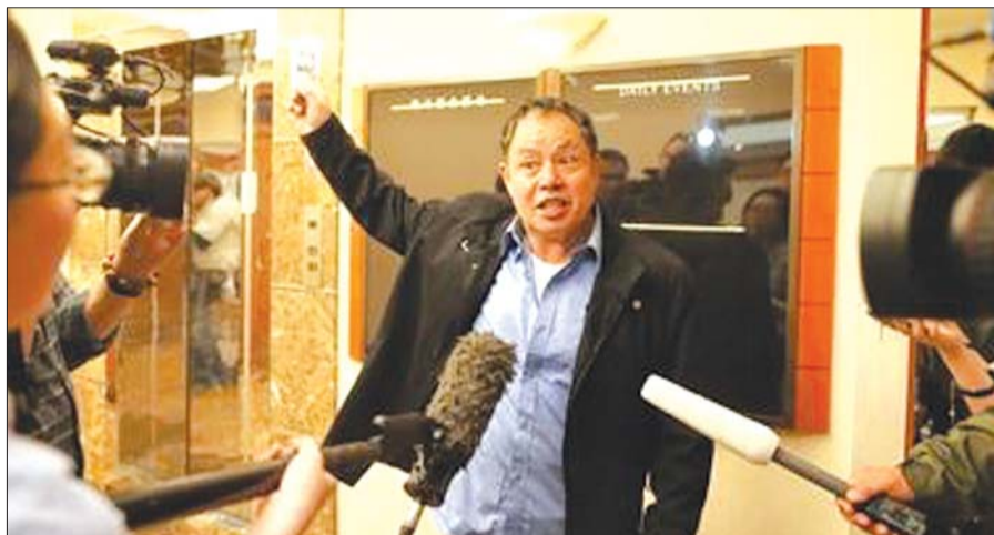
23日,丽都饭店,一名家属质疑马航。

记者随即致电英国航空事故调查局,该局新闻办公室表示,“暂时不会就MH370调查作出任何评价和回应,同时也不会接受采访。”