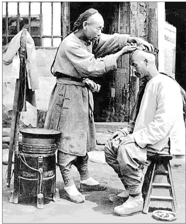
旧时街边剃头情景。(资料片)

那时候,妇女都在自己家中梳理头发,剃头的顾客全是男性。别看剃头的属于小商小贩,理发的工序和理发店没有两样,还给顾客挖耳朵,用竹制的挖耳勺把耳屎掏出,再用顶端绑有毛绒的竹签,在耳朵里一转就把耳屎碎末清理干净,这时顾客耳内会感到一阵说不出的舒服。最后在顾客的头、颈、肩等部位按摩一番,让顾客兴尽而归。老济南理发业有它的行会,会很很严,从前有个明文规定《净发须知》。过去,每当剃头的到来,人们能