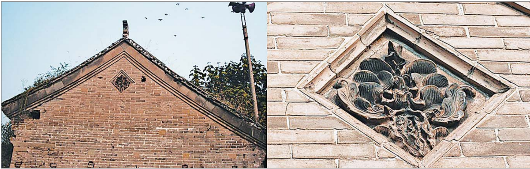
高家庄园精美的砖雕