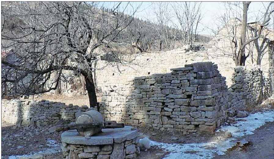
高家庄园(石泉山庄)遗迹

寿典期间,当时的大总统曹锟也赠了“巾幗完人”的大匾,邑内“五十里”土绅乡老、官宦名流送了“茹苦守贞”匾。贺帐、贺联为数之多更是难以计数,贺期长达四十余天而不散。