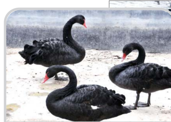
▲黑天鹅被放置在笼子里,等待放飞。

将鸟粮倒在饲养盘上。本来散游在水坑里的水鸟迅速游向饲养盘,扑腾着翅膀挤在饲养盘四周觅食。工人告诉记者,水鸟的警惕性很高,以前喂食时都是等他们走后才会靠近喂食。而现在因为喂食的数量和次数减少了,水鸟们完全放弃了警惕性,工人们站在旁边,水鸟们也会蜂拥抢食。