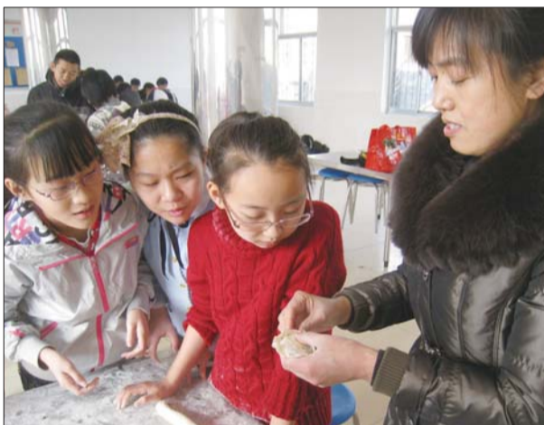
韩老师教学生们包饺子。

送了感谢信到学校,学校领导将感谢信在教学楼门厅展示了几天,用韩老师的实际行动为学生树立了榜样。