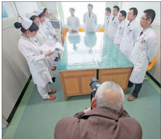
▲早上7时20分,老人在拍摄医护人员每天早晨的交接班。