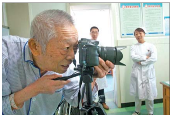
▲老人在医生办公室进行拍摄。