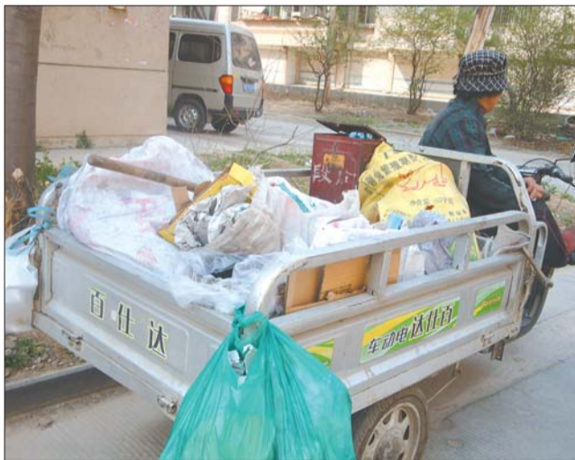
废品回收人员进入小区回收废品。

凤凰山庄南区另一位业主告诉记者，小区内废品回收价格的确很低，他们希望以较高的价格将废品卖出去。“每次都要将这些瓶瓶罐罐运到小区外面实在麻烦，我们也就太计较价钱了，为了方便就卖给小