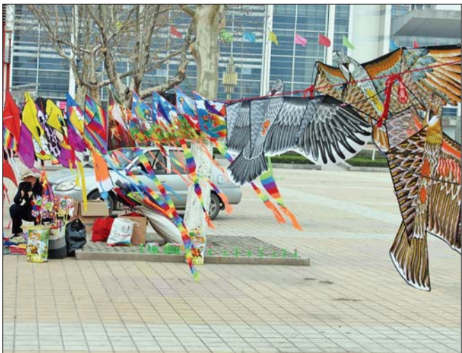
会展中心:春风吹拂风筝摊。