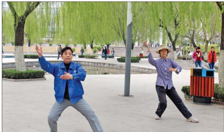
► 齐鲁软件园:柳荫下,市民打太极拳。