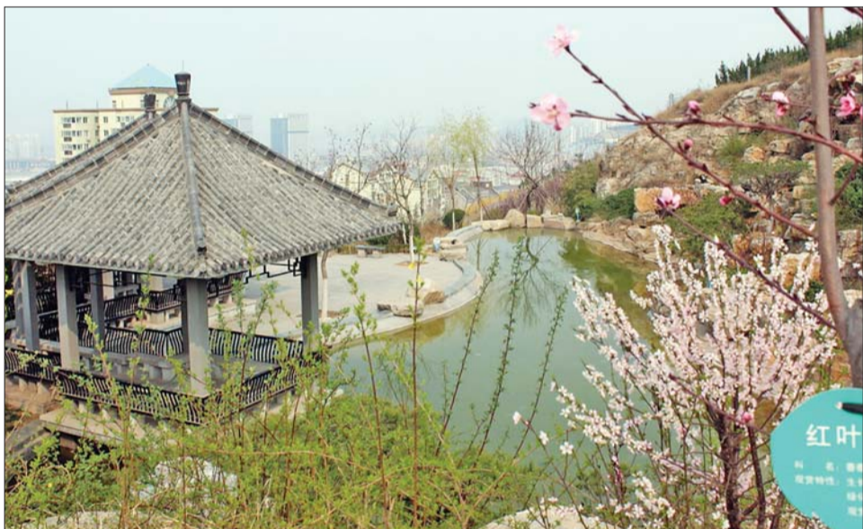
马山坡公园:亭边绿柳,山上花开。

广场: 不愿远行的人也可以从会展中心的广场上买上两只风筝,迎着春风放飞,或许就能忘却不少忧愁,找回童趣!