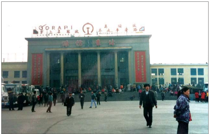
潍坊老火车站。高伟摄于2002年