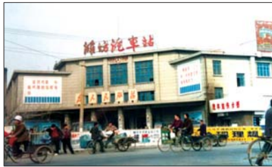
潍坊老汽车站。