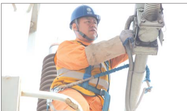
工作人员对供电设备进行检查。

停电一半安全运行,在两个危险点都设有专职监护人保证作业安全。工作人员需要拆卸变电站零部件,逐个将设备擦拭干净,有问