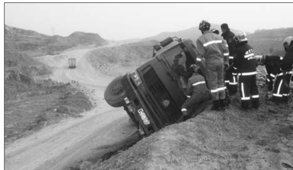
消防官兵破开防风玻璃。

据了解,此处路段已多次发生这样的事故,这里是一个三岔路口,运载石料的货车下山过程中,如果刹车不及时,极易失控撞在土堆上发生侧翻。