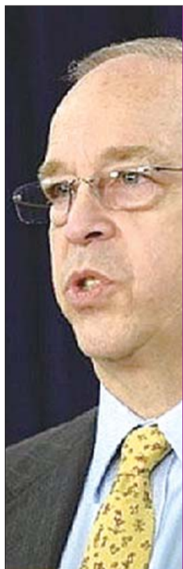
美国国务院亚太事务助理国务卿拉塞尔。(资料片)

自乌克兰危机爆发以来,外界一直有舆论认为美国将放弃“重返亚洲”战略,而把战略中心重新放回欧洲。在此背景下,美国国防部长哈格尔4月1日开始的“亚洲行”,似乎是在重申美国重返亚洲以对抗中国崛起的态度。