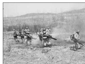
3日,在临港区一墓区,临港区消防队员联合护林员开展森林灭火实战化演练。