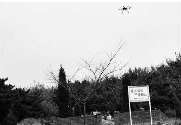
无人机航拍监控重点林区和墓区。