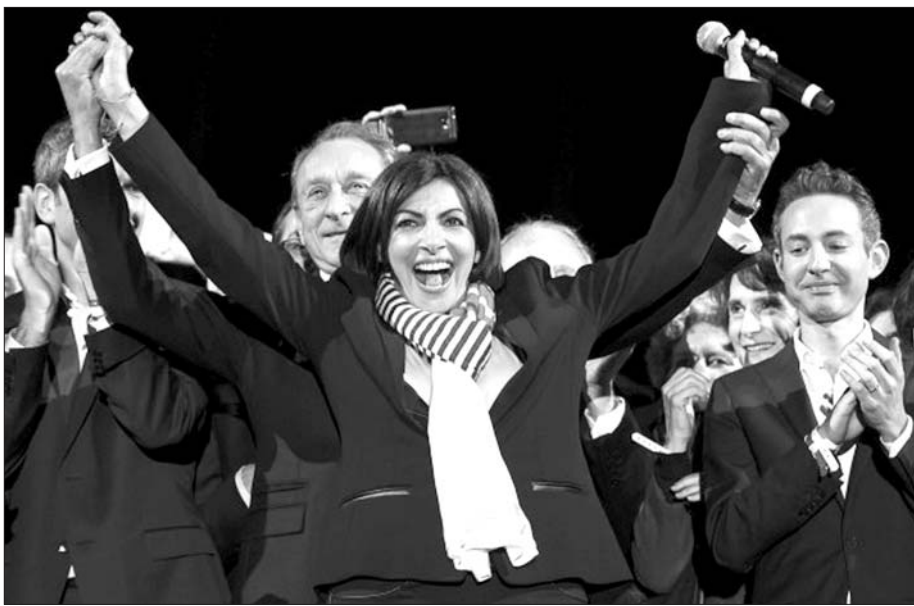
当选的伊达尔戈(中)欢庆胜利。

德拉诺埃2001年当选巴黎市长,是自1977年巴黎设立市长之职以来的首位左翼市长。同年,伊达尔戈担任巴黎市第一副市长。作为德拉诺埃的副手,她获得了包括市长在内的多数社会党人的支持和拥护。早在2009年,德拉诺埃就表示,伊达尔戈深得自己信